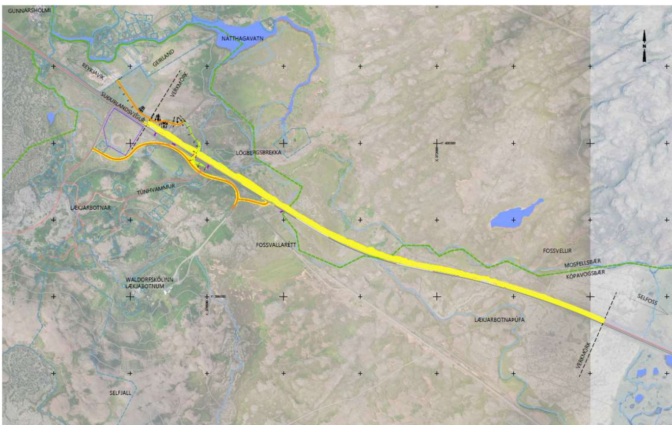
Mynd 1 Framkvæmdasvæði Suðurlandsvegur

Vegurinn verður breikkaður til norðurs en að öðru leiti er lega hans óbreytt. 11 m miðdeilir er milli axlabrúna núverandi akbrautar og hinnar nýju. Mynd 1 sýnir fyrirhugað framkvæmdasvæði.