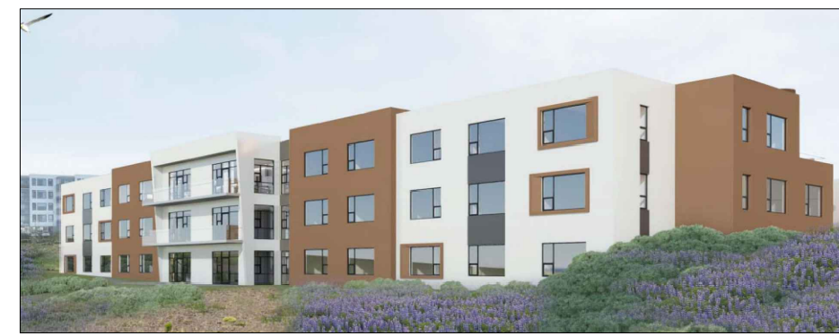
Skýringarmynd: Þrívíddarmynd - horft til suðvesturs frá Þingmannaleið