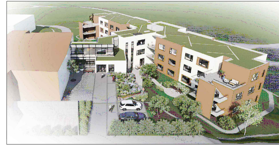
Skýringarmynd: Þrívíddarmynd - horft til norðurs frá Boðapingi 22