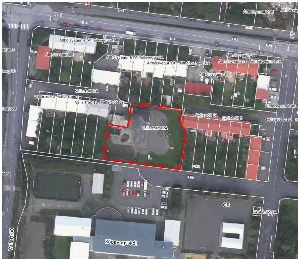
Mynd 1. Loftmynd. Deiliskipulagssvæði rammað inn með rauðri línu.

Fyrirhugað deiliskipulagssvæði nær yfir lóð við Skólatróð 12a þar sem í aðalskipulag Kópavogs 2019-2040 er gert ráð fyrir samfélagsþjónustu (S-6). Ekki er til deiliskipulag fyrir þennan reit og er því um að ræða nýtt deiliskipulag. Búið er að rífa tveggja deilda leikskóla á einni hæð sem áður stóð á lóðinni og fyrirhugað er að byggja fjögurra deilda leiksóla að hluta til á tveimur hæðum í stað hans. Tilgangur þessarar lýsingar er að taka saman helstu forsendur og setja fram markmið deiliskipulagsvinnu Skólatraðar 12a sem framundan er. Fyrirhugað deiliskipulag tekur til 0,2 ha lóðar sem er í eigu Kópavogsbæjar. Forsendum skipulagsgerðar er lýst og áherslur sveitarstjórnar dregnar fram. Að auki er fjallað um óverulegabreytingu á aðalskipulagi vegna reitsins sem er í samþykktarferli.