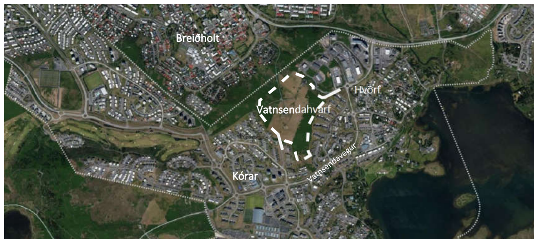
Mynd 1. Skýringarmynd. Fyrirhugað íbúðarhverfi í Vatnsendahvarfi /Vatnsendahæð. Loftmyndir ehf, loftmynd úr landupplýsingakerfi Kópavogs, LUKK. Myndin er ekki í mælikvarða.

Svæðið sem breytingin nær til er í Vatnsendahvarfi /Vatnsendahæð. Væntanlegt íbúðarhverfi er áætlað að fyrirhuguðum Arnarnesvegi til norðvesturs (á mörkum Kópavogs og Reykjavíkur), að íbúðarbyggð í Kórum til suðvesturs, fyrirhuguðu samfélagsþjónustusvæði (S-67) til suðurs, íbúðarbyggð í Hvörfum til austurs og athafnasvæði í Hvörfum til norðurs. Einnig verða aðkomuleiðir/tengibrautir frá Vatnsendavegi að/frá svæðinu (Kambavegur) skoðaðar. Sjá nánar kafla 4.1 um breytingu á aðalskipulagi.