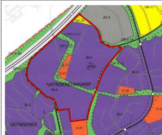
Aðalskipulag Kópavogs 2019-2040, hluti uppdráttar. Rauð lína afmarkar deiliskipulagssvæði. Mynd 4a.

sem talið er að hafi jákvæði áhrif og er unnið að breytingum á deiliskipulagstillögunni í framhaldi af þeim. Þá var ljóst að breyta þyrfti aðalskipulagi til að það yrði í samræmi við þær breytingar sem ákveðið var að fara í. Tekið er fram að samráð stendur enn yfir varðandi úrvinnslu deiliskipulagstillögunnar.