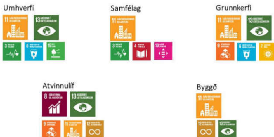
Mynd 10-1. Niðurstöður mikilvægisgreiningar eftir köflum aðalskipulags Kópavogs.

Hvernig heimsmarkmiðin skiptust niður á kafla aðalskipulagsins má sjá á meðfylgjandi mynd 1.