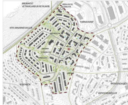
Tillaga að deiliskipulagi sem var forkynnt í mars-apríl 2022. Mynd 4b.

Myndir eingöngu birtar til skýringar. Myndirnar eru ekki í mælikvarða.