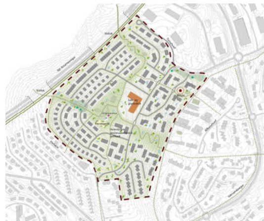
Tillaga að deiliskipulagi Vatnsendahæðar-Vatnsendahvarf, drög í vinnslu eftir forkynningu tillögu. Mynd 5b.