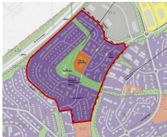
Drög að tillögu að breytingu á Aðalskipulagi Kópavogs 2019-2040 – hér birt til skýringar. Mynd 5a.

Myndir eingöngu birtar til skýringar. Myndirnar eru ekki í mælikvarða.