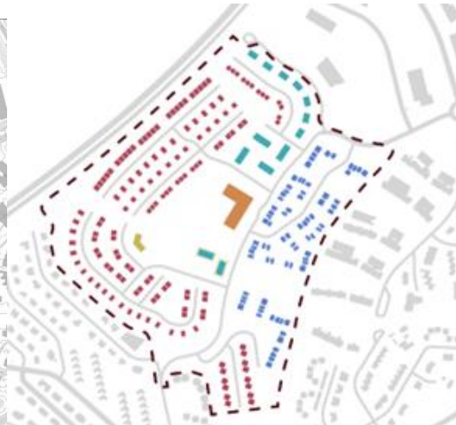
Tillaga að deiliskipulagi dags. 20.02.2023