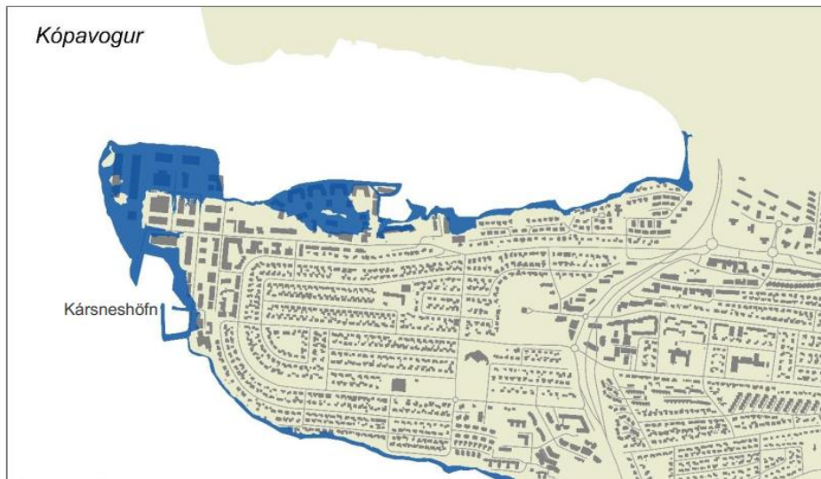
Mynd 4 Möguleg sjávarflóðasvæði í Kópavogi miðað við 4 m flóð í hæðakerfi Reykjavíkur (VSÓ, 2016).

Setja þarf skilmála í deiliskipulag þar sem gert er ráð fyrir forsendum um hækkandi sjávarstöðu. Í minnisblaði siglingasviðs Vegagerðarinnar til Kópavogsbæjar um hæð á landfyllingum í Fossvogi er lagt til að lágmarks gólfkótar húsa á landfyllingum í Fossvogi séu um 0,3 m hærri en lágmarks hæð landfyllingar, eða 4,41 m í hæðakerfi Reykjavíkurborgar og 6,23 m í hæðakerfi Sjómælinga Íslands.