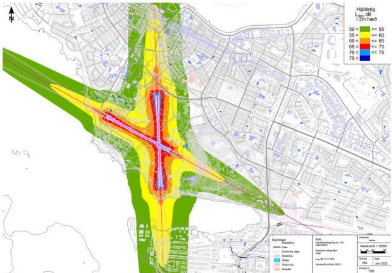
MYND 2 HÁVAÐAKORT (2 M YFIR JÖRD) FYRIR FLUGUMFERÐ FRÁ MAÍ TIL OKTÓBER 2021. ÚR SKÝRSLU EFLU (2022).