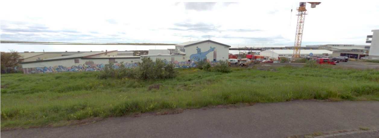
MYND 3 MUN VÍKJA.

Núverandi húsnæði innan svæðis 13 samanstendur af tveggja til þriggja hæða atvinnuhúsnæði, nýtt undir ýmsa starfsemi. Íbúðabyggð á Þinghólsbraut liggur upp að deiliskipulagssvæði til austurs. Götusýn frá Þinghólsbraut má sjá á mynd 3.