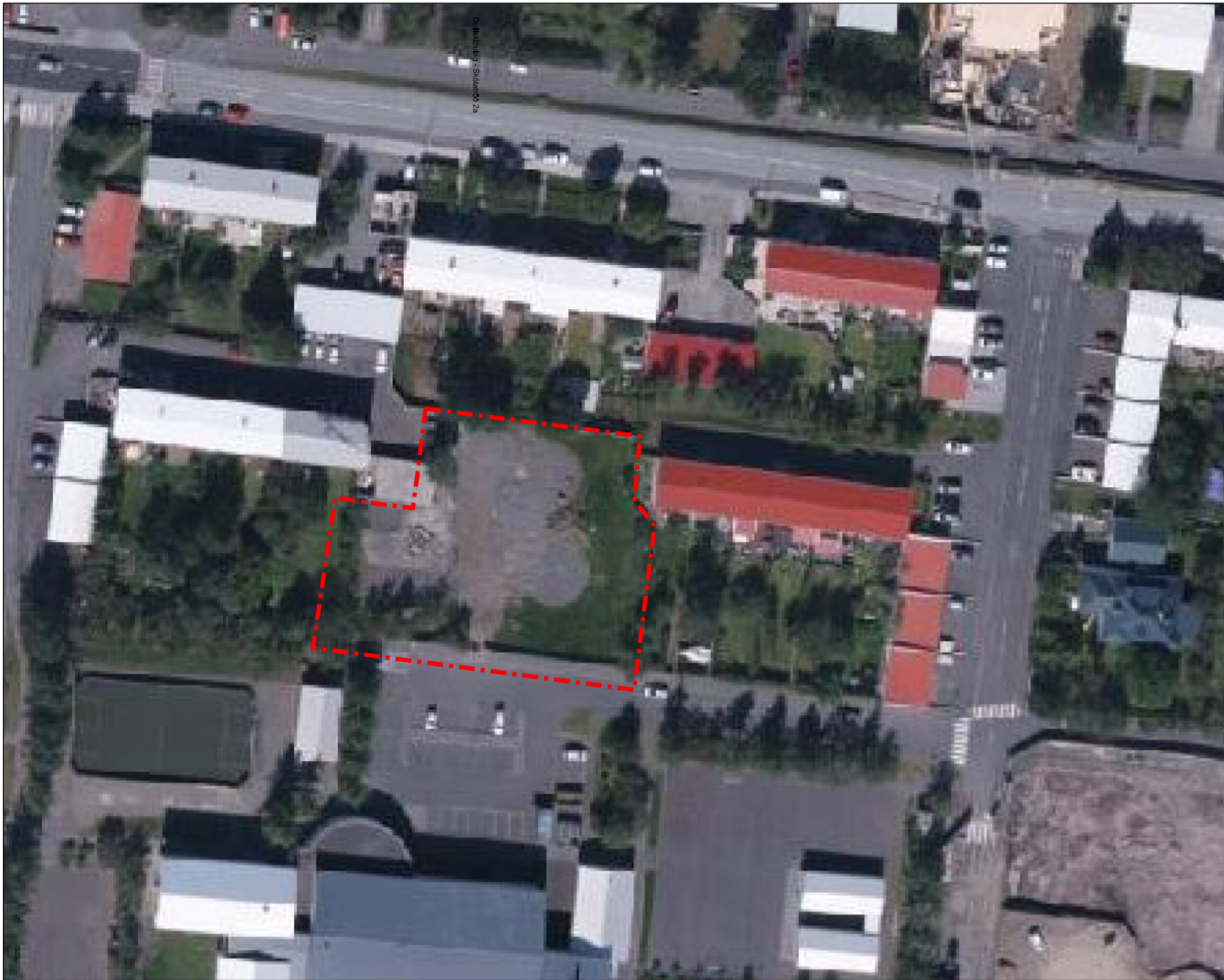
Núverandi staða á lóðinni - Loftmynd