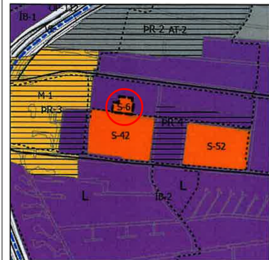
Aðalskipulag Kópavogs 2019-2040 m.s.br.

Halda skal í þann gróður sem er umhverfis lóðina eins og kostur er. Heimilt er að hafa lágan gróður á lóðarmörkum.