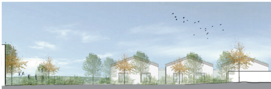
Skýringarmynd - norður ásýnd leikskólans