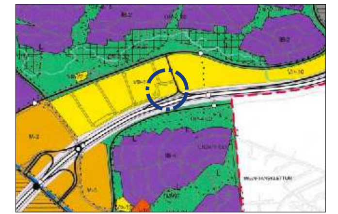
HLUTI GILDANDI AÐALSKIPULAGS 2019-2040

Skipulagsleg staða - aðalskipulag Í gildandi Aðalskipulagi Kópavogs 2019 - 2040 er skipulagssvæðið skilgreint á svæði 1 samgöngumiðuðu þróunarsvæði sem (VP 10) Verzlunar og þjónustu reitur. Breyting á deiliskipulagi er í samræmi við gildandi aðalskipulag.