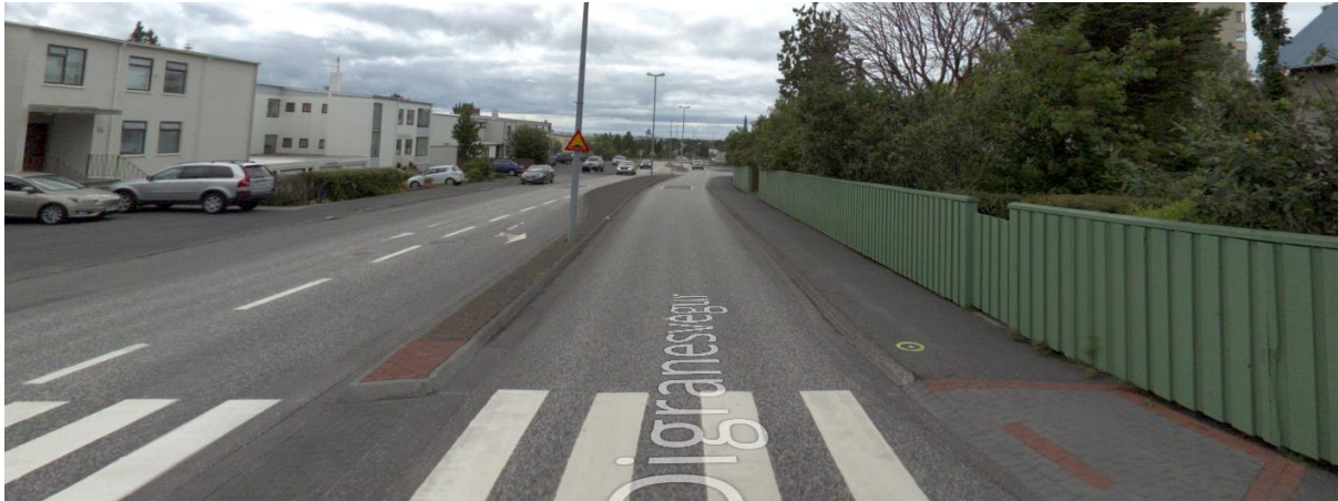
Mynd 5 Hljóðvarnir á Digranesvegi á milli Neðstuttraðar og Vallartraðar.

Bent er á að æskilegt er að þegar hönnun hefur verið nánar útfærð verði unnir útreikningar á hávaða sem gæfu til kynna hvort og hvar bregðast þyrfti við með mótvægisáðgerðum sem dregið geti úr mögulegum neikvæðum áhrifum umferðaraukningar.