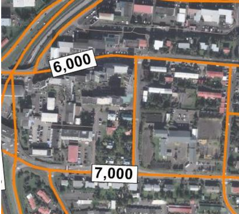
Mynd 2 Áætluð sólarhringsumferð á Digranesvegi (7.000) og Hamraborg (6.000) á virkum dögum árið 2019.

Samkvæmt kortlagningu umferðar í Kópavogi árið 2019 er áætluð umferð um Digranesveg við Vallartröð um 7.000 bílar á sólarhring (á virkum dögum) og 6.000 bílar á sólarhring um Hamraborg. Um Vallartröð fara um 800 bílar á sólarhring í dag.