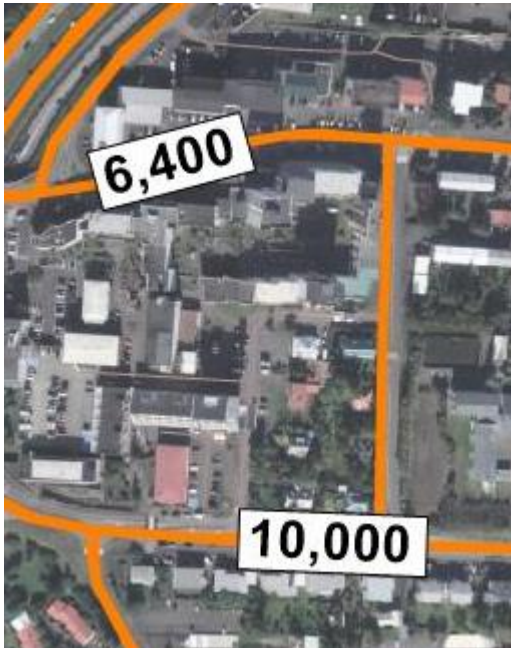
Mynd 3 Áætluð sólarhringsumferð á Digranesvegi (10.000) og Hamraborg (6.400) á virkum dögum árið 2030.

Samkvæmt þessu verður umferðaraukningin meiri á Digranesvegi en Hamraborg en mest verður aukning um Vallartröð og færi hversdagsumferð þar úr 800 bílum á sólarhring árið 2019 í 4.700 bíla á sólarhring árið 2030. Megin niðurstöður umferðarspár er að gatnanet ráði við fyrirhugaða uppbyggingu í Hamraborg miðað við gefnar forsendur. Eins og áður segir eru forsendur að baki þessum útreikningum m.a. þær að breyttar ferðavenjur til framtíðar verði þess valdandi að umferð verði 30 % minni á þessu svæði en ella. Slíkt er í samræmi við markmið Kópavogsbæjar og svæðisskipulags höfuðborgarsvæðisins um aukningu vistvænna samgöngumáta til framtíðar sem leiðir af sér breyttar ferðavenjur. Fyrirhugað deiliskipulag styður þau markmið.