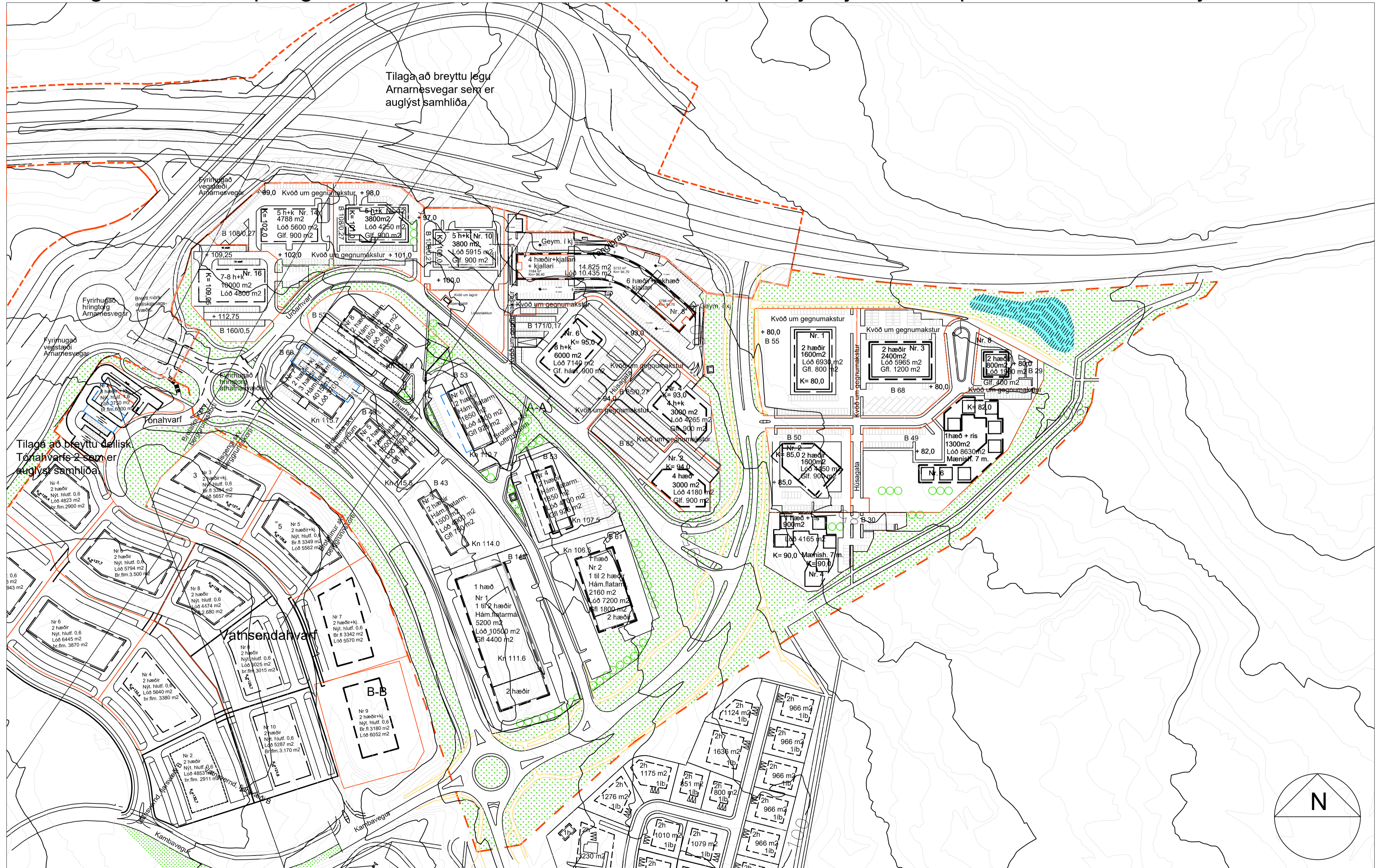
Tillaga að breyttu deiliskipulagi Vatnsendahvarf - athafnasvæði