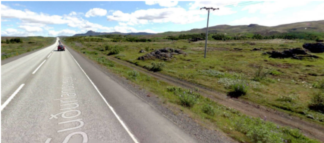
Mynd 2. Ekki er rými fyrir mikið meira en vegslóða á milli núverandi Suðurlandsvegur og nyrsta Tröllabarnsins.