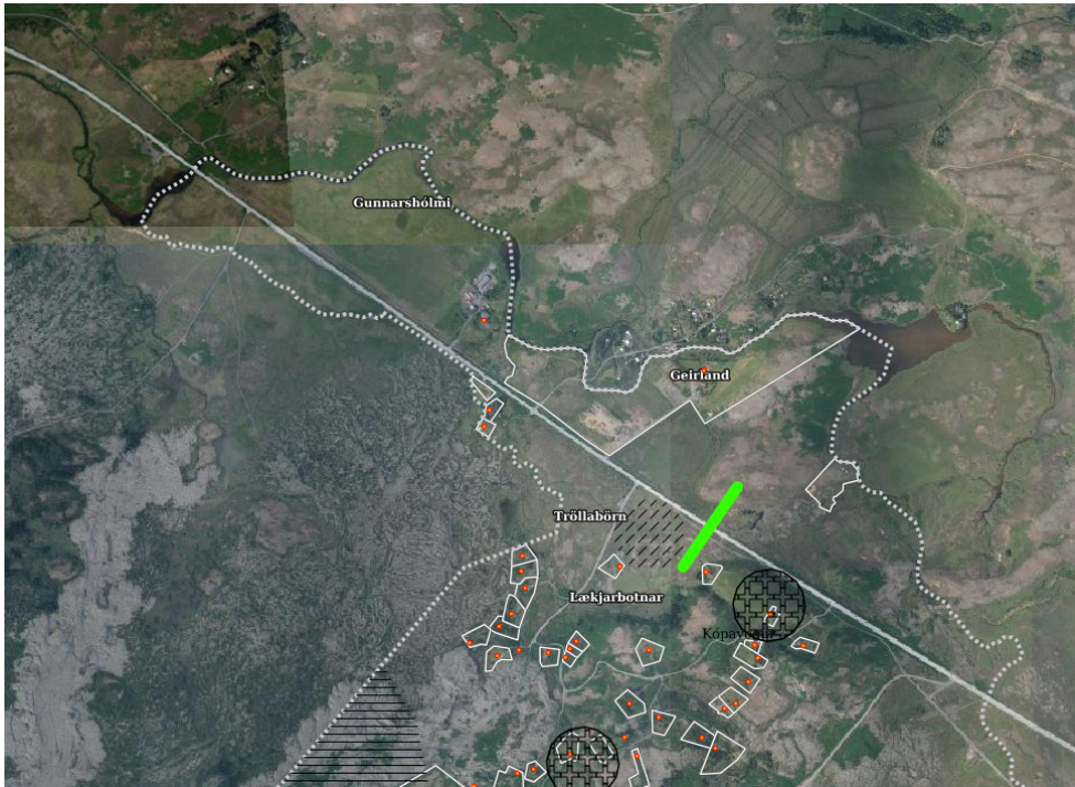
Mynd 2: Verkmörk framkvæmdarinnar austan Tröllabarna táknuð með grænu.

Jafnframt er áréttað að mörk svæðisins sem ofangreind framkvæmdarleyfisumsókn tekur til er frá Fossvöllum að Lögbergsbrekku rétt austan friðlýsta svæðisins Tröllabörn.