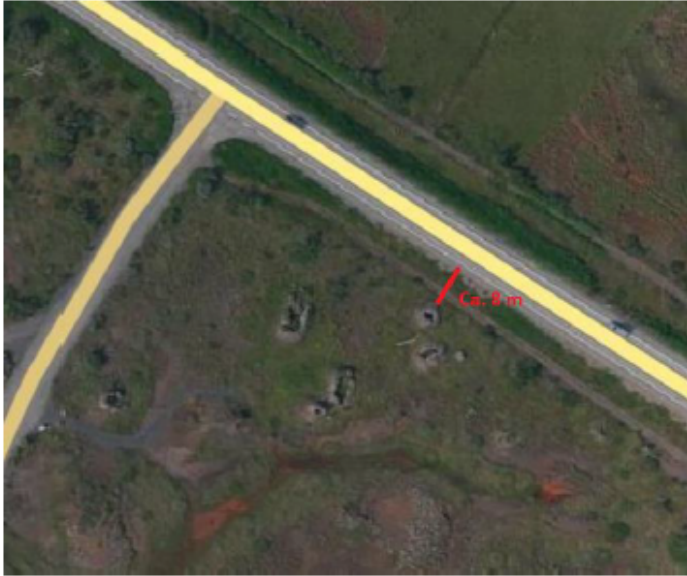
Mynd 1. Nyrstu Tröllabörnin eru í um 8 m fjarlægð frá vegöxl núverandi Suðurlandsvegur.