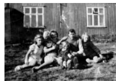
Á hlaðinu við Digranesbæ. Myndin er að líkindum tekin 1945. Ekki er vitað hvað fólkíð á myndinni heitir.