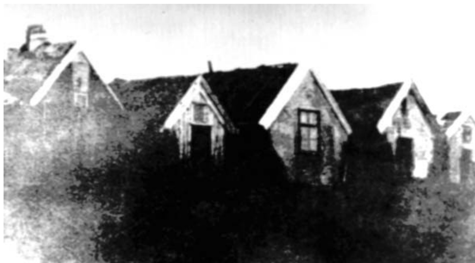
Digranes um 1900