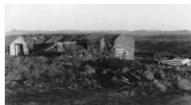
Digranes um 1960.