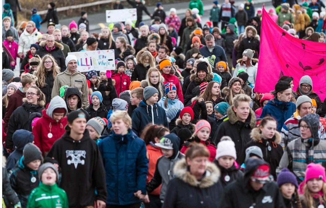
Börn og kennarar í göngu gegn einelti